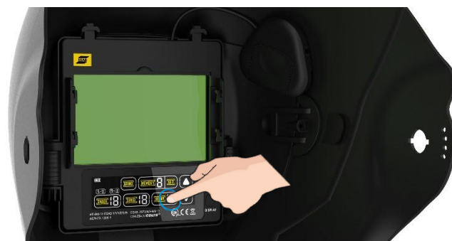
ADF di classe ottica elevata, con interfaccia touchscreen a colori