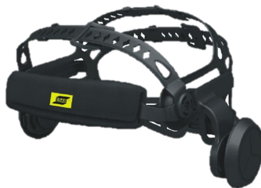
Imbracatura comfort in 5 punti Halo™ (vista frontale)

Per maggiori informazioni, visitare esab.com .